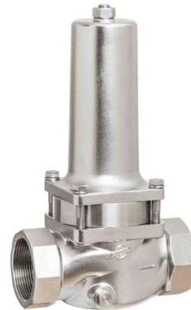
DN 40 - DN 50