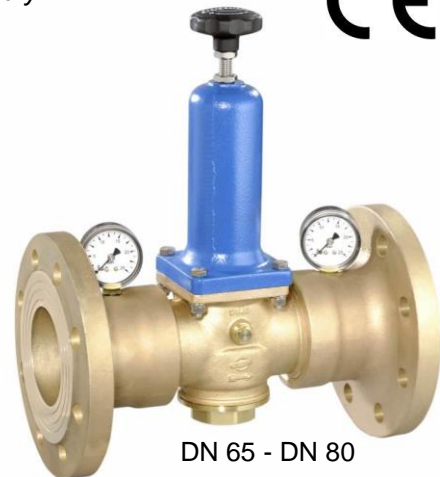
DN 65 - DN 80

(Ausführung DN 65 & 80 mit separaten Manometeranschlüssen / version DN 65 & 80 with separate manometer connections)