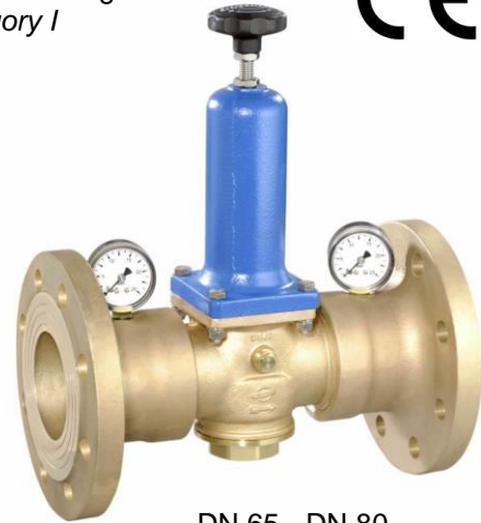
DN 65 - DN 80

(Ausführung DN 65 & 80 mit separaten Manometeranschlüssen / version DN 65 & 80 with separate manometer connections)