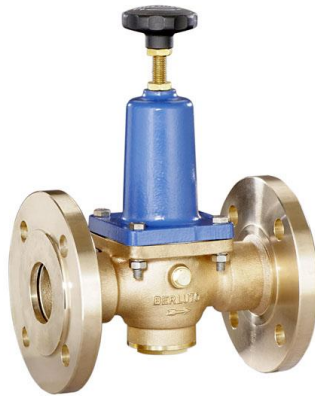
DN 40 - DN 50