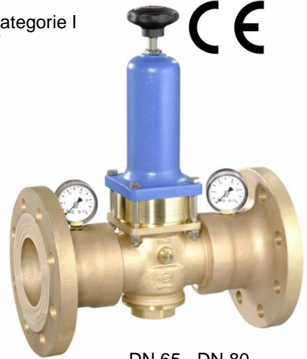
DN 65 - DN 80

(Ausführung DN 65 & 80 mit separaten Manometeranschlüssen / version DN 65 & 80 with separate manometer connections)