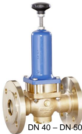
DN 40 – DN 50