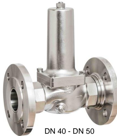
DN 40 - DN 50