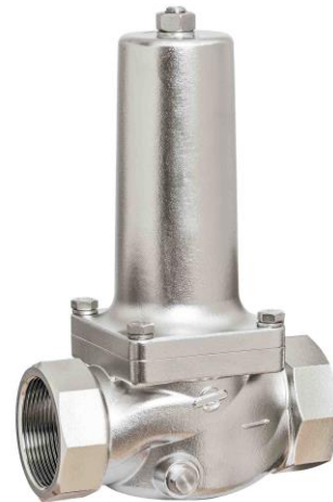
DN 40 - DN 50